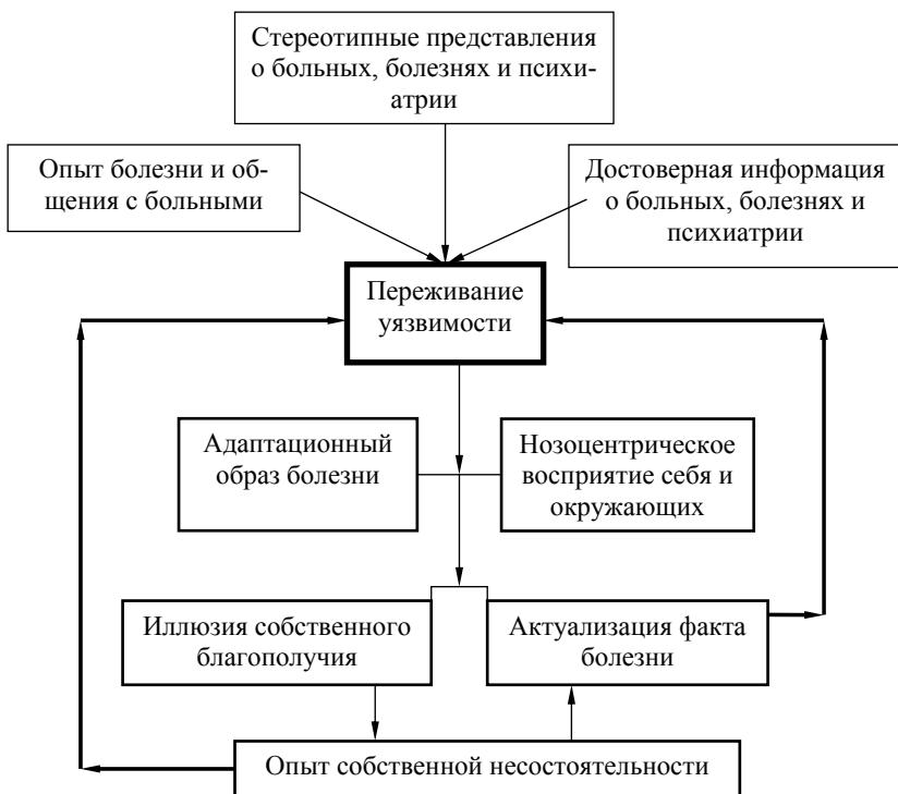
Рис. 2. Структурно-динамическая модель самостигматизации

В разных нозологических группах каждая форма самостигматизации отражает особый набор и тип взаимодействия клинических, личностных и иных факторов. Указанная закономерность определила необходимость разработки трех типологий самостигматизации.